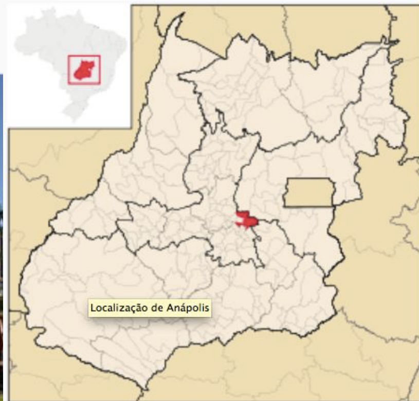
Localização de Anápolis em Goiás